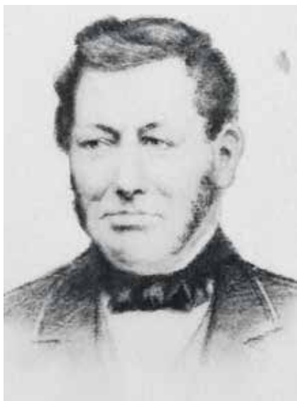
Le portrait est tiré de l'ouvrage Neuchâtel Jubilé 1848-1898, Neuchâtel .