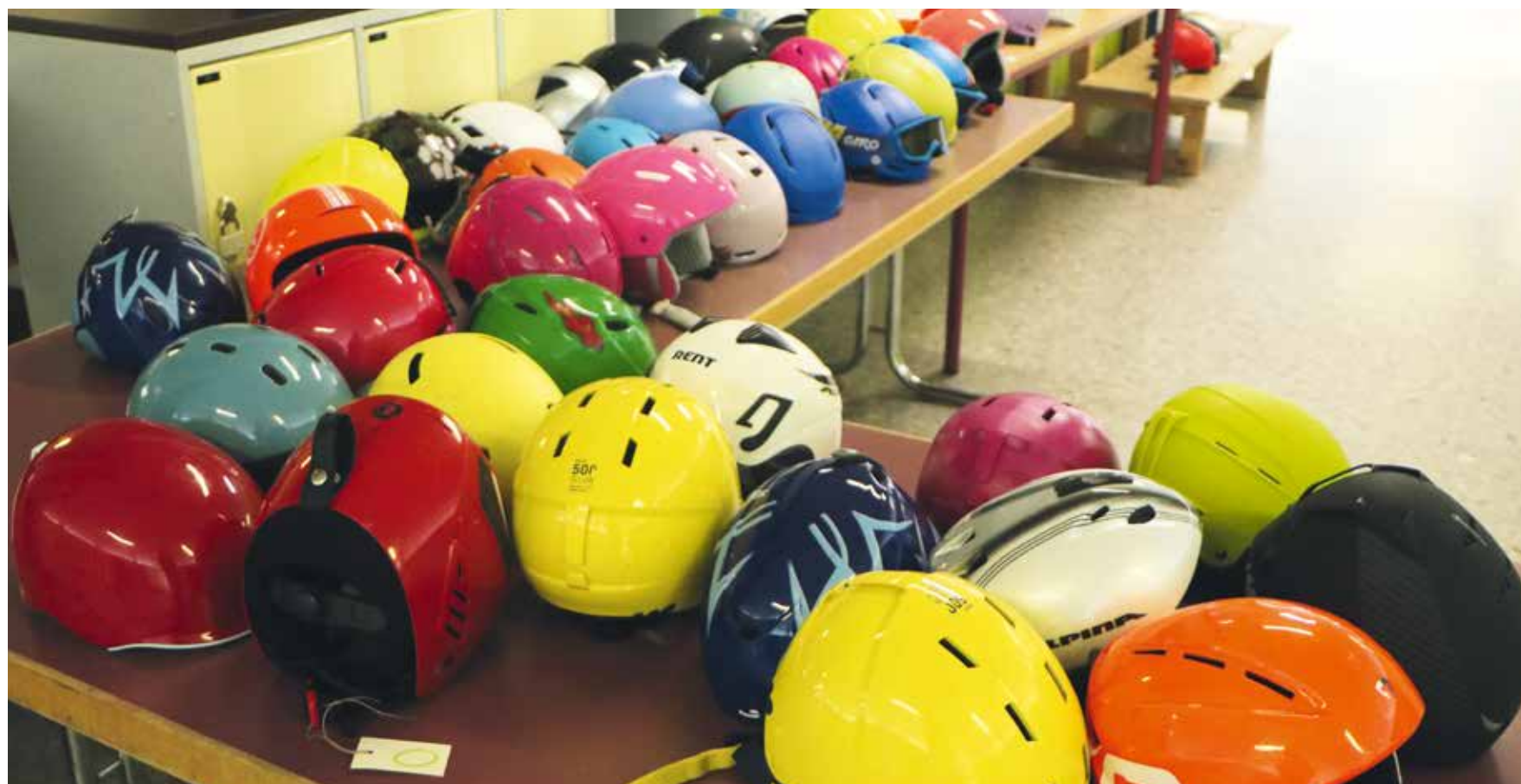
Multicolores, ils ont trouvé preneurs (lire en page 3). Organisé pour la première fois en 1972, le Troc d'hiver de Cernier est une affaire qui roule (photo pif).