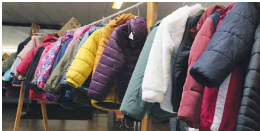
La quantité d'articles à vendre était imposante; la moitié a trouvé preneurs.

Le Troc du Val-de-Ruz conserve sa raison d'être. Démonstration à l'appui, le 1 er novembre, dans le hall du collège de La Fontenelle, à Cernier. Les skis d'occasion pour enfants se sont arrachés comme des petits pains.