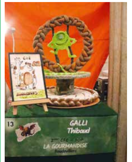
La réalisation de Thibaud Galli.

Un chiffre encore: en une petite semaine, plus de 100 kilos de chocolat ont été dégustés dans le cadre de l'événement.