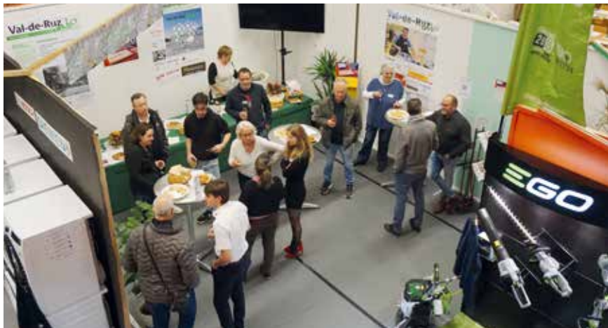
Convivialité assurée au stand de Val-de-Ruz info.

Ouverture d'un bureau, présence plus active sur les réseaux sociaux, redynamisation de son contenu: au moment de fêter ses 15 ans, Val-de-Ruz info se projette dans l'avenir avec toujours la même envie: raconter la vie de la région avec et pour ses habitants.