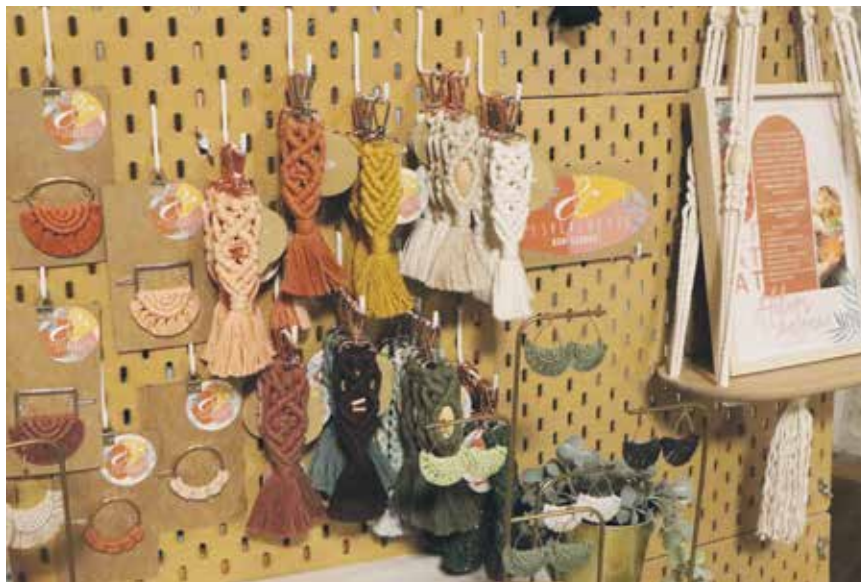
Marché de Noël des créatrices: une occasion de découvrir l'artisanat local.

Les traditionnels spectacles de la FSG Dombresson-Villiers auront lieu le samedi 29 novembre dès 11h et dès 19h sur le thème «Le voyage dans le temps». Dès 21h paella sur réservations: info@fsg-dombresson-villiers.ch .